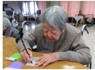
お雛様の顔を書きます