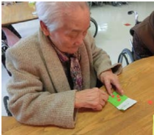
「細かい作業は難しい…」